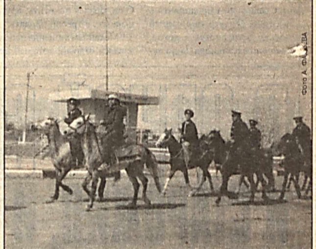
Большой вклад в дело охраны общественного порядка наряду с сотрудниками милиции вносят члены общественного формирования «Халк посбонлари», в частности, их силы направлены на охрану приграничных районов области.