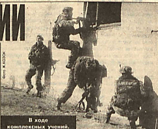
В ходе комплексных учений.