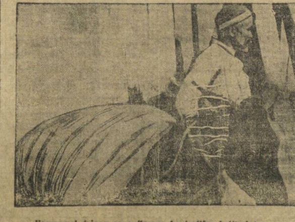
Markaziy biraqumning o'z qo'llanma ko'rsatmalariga ko'ra ishlayotgan

Butun xalq komissarlarining roli haqida qararlar qaratildi. Butun xalq komissarlarining roli haqida qararlar qaratildi.