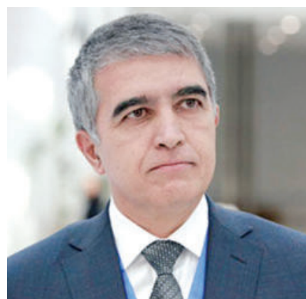
Шавкат ҲАМРОЕВ, Ўзбекистон Республикаси сув ҳўжалиги вазири

Президентимиз раислигида 24 февраль куни қишлоқ ва сув ҳўжалиги соҳасида жорий йилда амалга ошириладиган устувор вазифалар муҳокамаси юзасидан ўтказилган видеоселектор йиғилишида экинлардан олинадиган даромадни кескин кўпайтириш ва сувдан оқилон фойдаланиш тармоқда энг асосий масала бўлиши кераклиги таъкидланди.