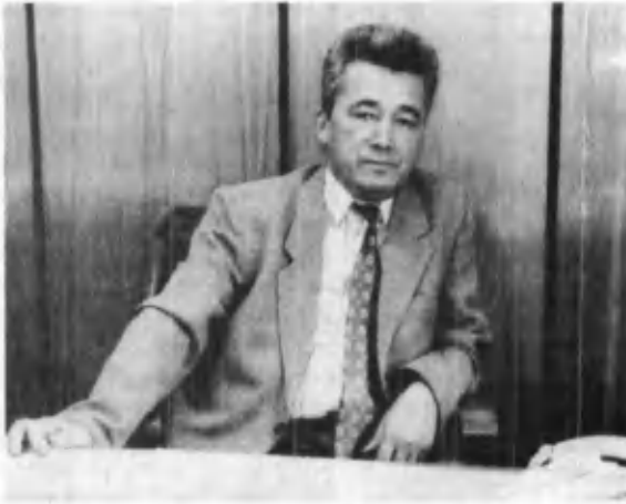
Омон Матжон Ўзбекистон халқ шоири