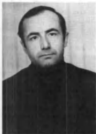
Садриддин Салим Бухорий