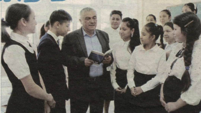
7-sinf o'quvchilari bilan muloqot savol-javoblarga boy tarzda o'tdi.

Keyingi uchrashuvimiz Shayxontohur tumanidagi 157-umumta'lim maktabida bo'ldi. 7–8-sinf o'quvchilari yig'ilgan faollar zalida boshlangan suhbatimiz mutolaa-ga, bilim olishning ahamiyati haqida bordi. Ashurali