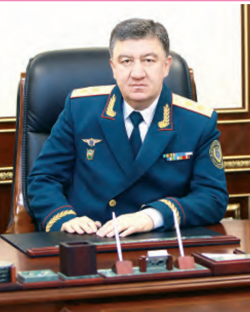
Таҳририятимизнинг жорий йилги лойиҳаси бўйича навбатдаги “Сиртқи қабул”ни Ички ишлар вазири Пўлат Раззоқович Бобожонов билан ўтказишга қарор қилинди. Таклифимизни қўллаб-қувватлагани учун Пўлат Раззоқовичга миннатдорлик билдирдимиз.