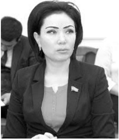
Зулайхо АКРАМОВА, Олий Мажлис Қонунчилик палатасидаги ҲўХДП фракцияси аъзоси.