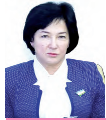
Кизилгул ҚОСИМОВА, Олий Мажлис Қонунчилик палатасидаги ЎзХДП фракцияси аъзоси:

Олий Мажлис Қонунчилик палатаси депутатлари Давлат дастурида белгиланган вазифалардан келиб чиқиб, ўз фаолиятларининг асосий йўналишларини белгилаб олишмоқда.