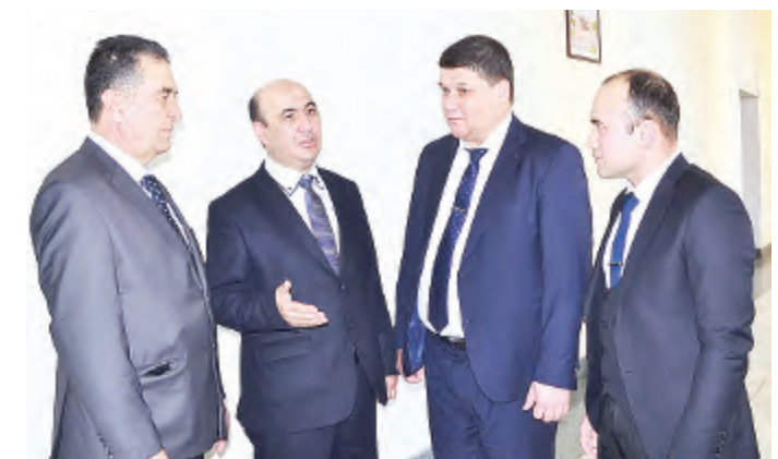
Рустам ХОЛМУРОДОВ, Самарқанд давлат университети ректори, профессор, Олий Мажлис Сенати аъзоси:

— Президентимиз Шавкат Мирзиёевнинг инсон ресурсларидан оқилона фойдаланиш борасидаги сиёсати бугун нафақат Ўзбекистонда, балки хорижда ҳам халқаро экспертлар томонидан эътибор этилмоқда. Буни Самарқанд давлат университетида “Инсон ресурслари: муаммолар, ечимлар ва истиқболлар” мавзусида ўтказилган халқаро анжуман иштирокчилари ҳам тасдиқлашди. Ўзбекистонда бугун инсон ресурсларини тадқиқ этиш бора-сида ҳам катта таъриба тўпланди. Навбатдаги вазифа инсон ресурсларини фан, илм даражасига чиқариш, бу борада хориж таърибасини ўрганиш ва таҳлил қилишдан иборатдир.