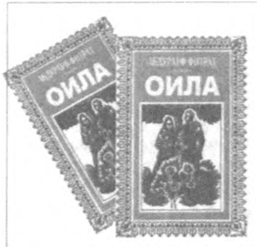
Гуради. — Бугун французларнинг мамлақати ва миллати жар лабига келиб қол-

шарифлардан мисоллар келтирилиб, таҳлил қилинган. Фарзанд воёга етар экан, у аввало ота-онанин эъзозлайдиган, солиқ ўқилардан бўлиши, қолаверса элу юртга хизмат қиладиган, шарафини ҳимоя қила оладиган ботир, баркамол инсон бўлиб воёга етиши лозим. Бу борада ҳам рисолада етарлича, ҳар бир оилга дастур бўладиган фикр-мулоҳазалар баён этилган. Фитрат эсади: «Энди фарзанднинг вазифаси Курьонда ушбу тарзда тайин этил-