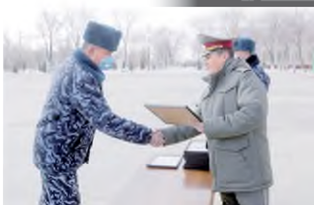
Шимоли-ғарбий ҳарбий округ матбуот хизмати

Шимоли-ғарбий ҳарбий округга қарашли Нукус гарнизонидаги ҳарбий қисмлардан бирида Қорақалпоғистон Республикаси Ички ишлар вазирлигининг жиноятчиликка қарши курашиш фаолиятини амалга оширувчи ходимлари таҳсил олиши учун ташкил этилган ихтисослаштирилган ўқув курсларининг битирувиги бағишланган тантанали маросим бўлиб ўтди.