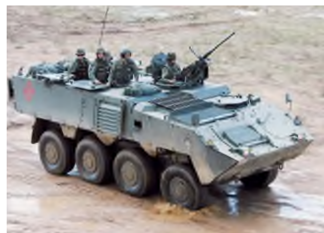
П. САЙДИВАЛИЕВ тайёрлади.

Хулоса ўрнида айтиш мумкинки, Австриянинг бошқа Европа давлатлари билан таққослаганда нисбатан кам сонли ҳарбий контингентга эга бўлган Қуруқликдаги қўшинлари ҳозирги даврга келиб тинчлик вақтида ҳам, уруш юзага келган ҳолатда ҳам қўйилган вазифаларни самарали ҳал қилишга қодир, деб ҳисобланади. Зеро, бу турдаги қўшинлар, юқорида таъкидлаб ўтилганидек, замонавий қурол-яроғ ва ҳарбий техника билан таъминланмоқда, эскирганлари эса модернизация қилинмоқда ёки янгилари билан алмаштирилмоқда.