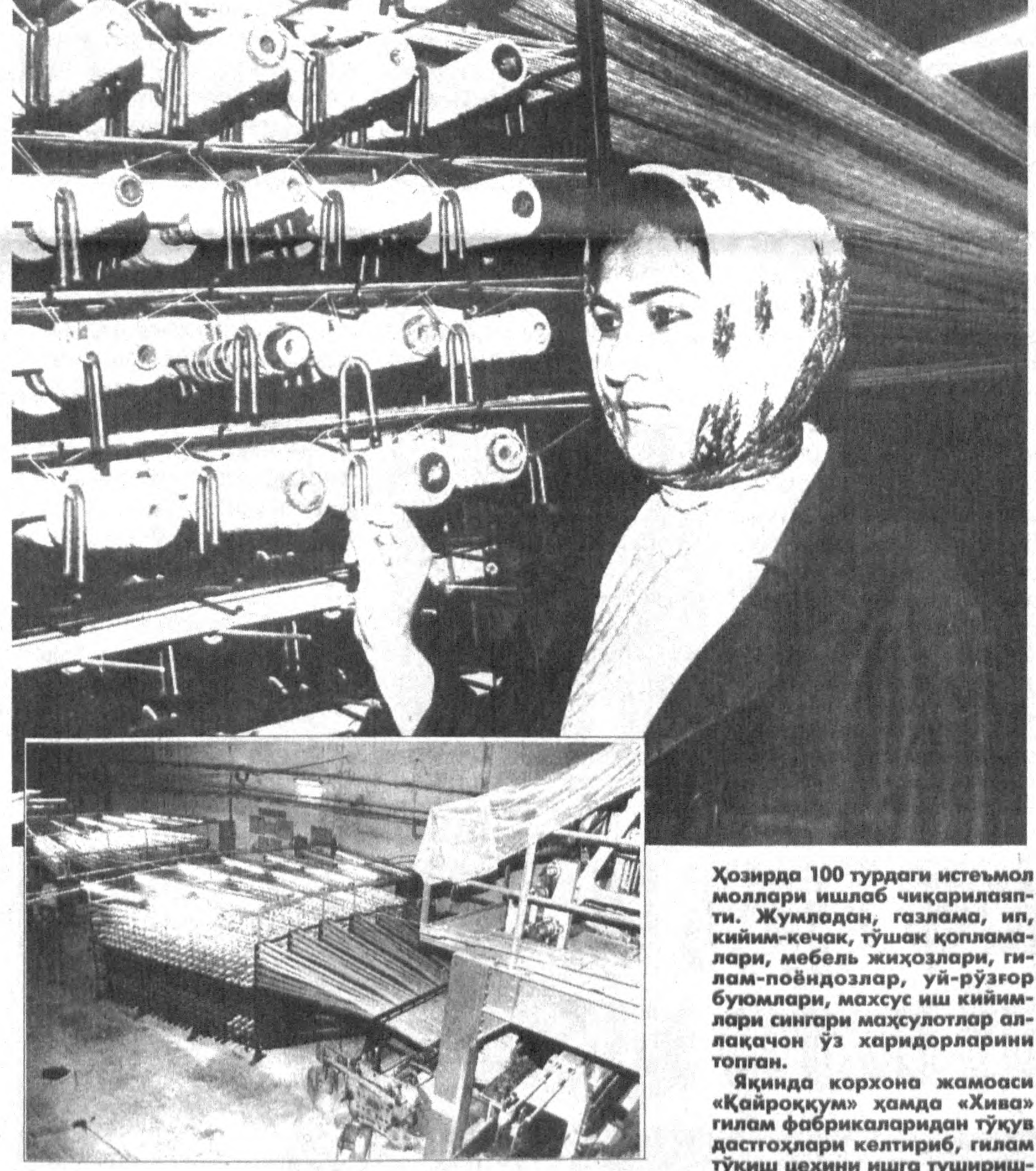
Ҳозирда 100 турдаги истеъмол моллари ишлаб чиқарилаётган. Жульдон, газлама, ил, кийим-кечас, тўшак қопламалари, меъбел жихозлари, гилом-пояндозлар, уй-рўзгор буюмлари, махсус иш кийимлари сингари маҳсулотлар аллақачон ўз ҳаридорларини топган.

Махмуджон ПАРШИЕВ, «Ўзбекистон овози» мухбири