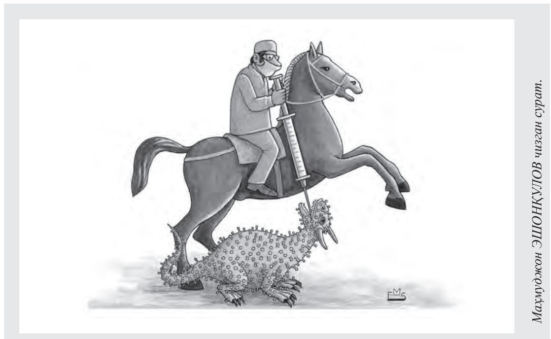
Махмуджон ЭШОНҚУЛОВ чизган сурат.