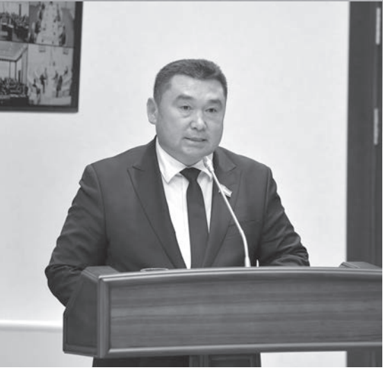
Рискул Сидиков. Заместитель председателя Комитета Сената Олий Мажлиси Республики Узбекистан по аграрным, водохозяйственным вопросам и экологии.