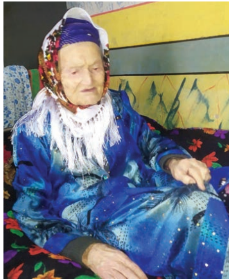
Табаррук момодан Бешмарган қишлоғининг ёшу қариси тез-тез хабар

Бугун Ўғилжон момо Эшёзова дорилон кунларга шукрона келтириб, беш неvara, 12 чевара ва элу юрти ардоғида умргузаронлик қилмоқда. Дарвоқе, ўтган йили Россия Федерацияси Президенти В.Путин томонидан Ўғилжон момо «Буюк ғалабанинг 75 йиллиги» медали билан тақдирланди.