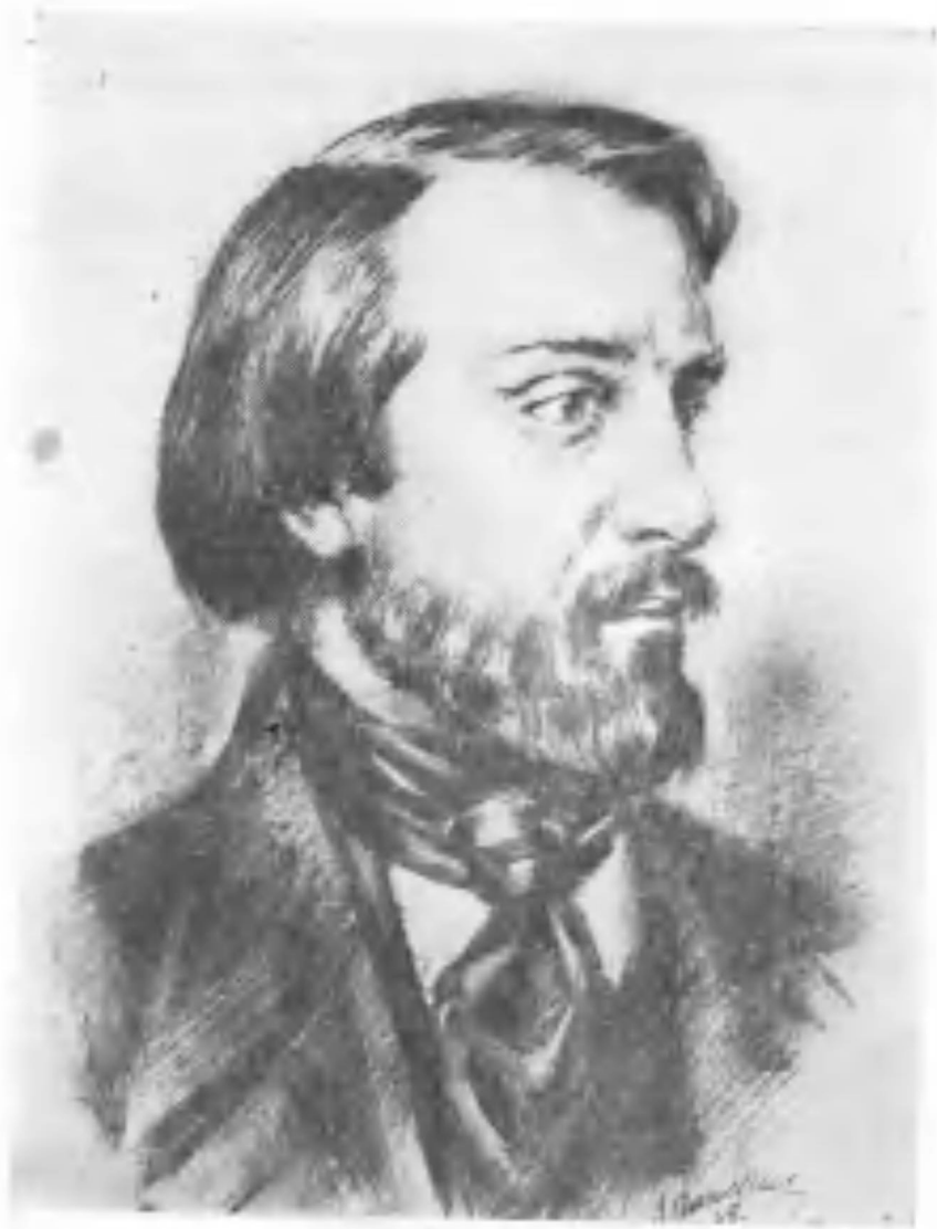
ВИССАРИОН ГРИГОРЬЕВИЧ БЕЛИНСКИЙ