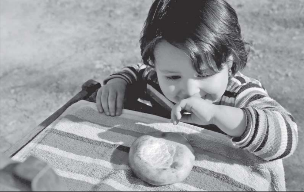
Дар парки тематикаки «Водии афсонаҳо»-и шаҳри Намангон Чашнвораи нон баргузор мегардад.

Дар чорабиние, ки бо мақсади баланд бардоштани иқтидори сайёҳии вилоят нигаронида шудааст, ҳафт танӯр сохта шуд, дар танӯрохонӣ нонҳо пухта мешаванд, ки навъ ва намудиҳои гуногун доранд. Ба Чашнвораи нон меҳмонон ва сайёҳҳо аз мамлакатамон ва ҷумҳуриҳои ҳамсоя меоянд. Нонҳо, ки аз қониби нонвойҳои таҷрибанок пухта шудаанд, ба хонаҳои саховат ва меҳрубоии фириостада мешаванд. Дар доираи чашнвора «Як тоқӣ ош», «Таомҳои танӯри»-барин шоу, бозихи миллӣ, чорабинӣҳои мадани баргузор мегардад.