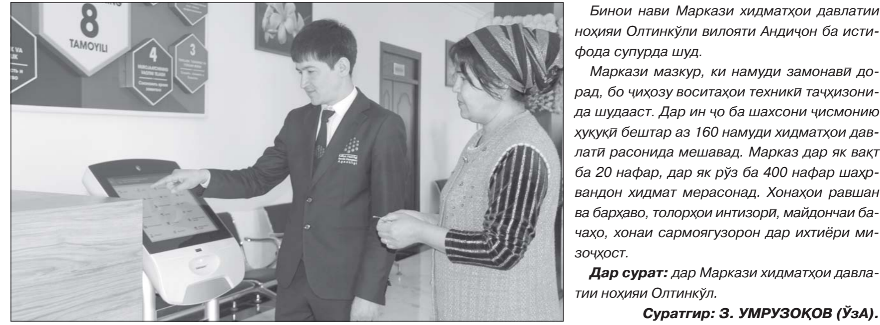
Биоии нави Маркази хидматҳои давлатии ноҳияи Олтинқули вилояти Андиҷон ба истифода супурда шуд.

Маркази мазкур, ки намуди замонавӣ дорад, бо ҷиҳозу воситаҳои техникӣ таҷҳизонида шудааст. Дар ин чо ба шахсонӣи ҷисмонӣи ҳуқуқӣ бештар аз 160 намуди хидматҳои давлатӣ расонида мешавад. Марказ дар як вақт ба 20 нафара, дар як рӯз ба 400 нафар шахравандон хидмат мерасонад. Хонаҳои равшан ва барҷаво, толарҳои интизорӣ, майдончаи баҷаҳо, хонаи сармоғгуздорон дар ихтиёри миозоҷоқост.