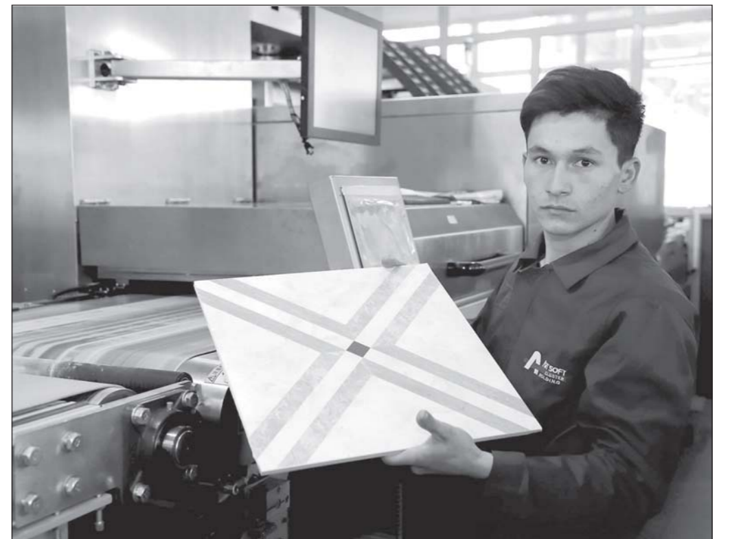
Дар хузури ширкати «Art soft holding»-и вилояти Намангон ҚММ тахти бренди «Flat Tile» ба фаволият сар кард.

Қорхона ба истеҳсоли махсулоти кафел-керамика махсусонида шудааст. Барои лоиҳаи нав ташаббускор 73 миллиард сӯми маблагӣ худро сарф кард, боз 52 миллиард сӯми аз банк кредит гирифт, қамъ 125 миллиард сӯми маблаг сарф карда шуд. Иқтисодии истеҳсо-ли қорхона дар як сол 35 миллиард сӯми ташкил намоёнд.