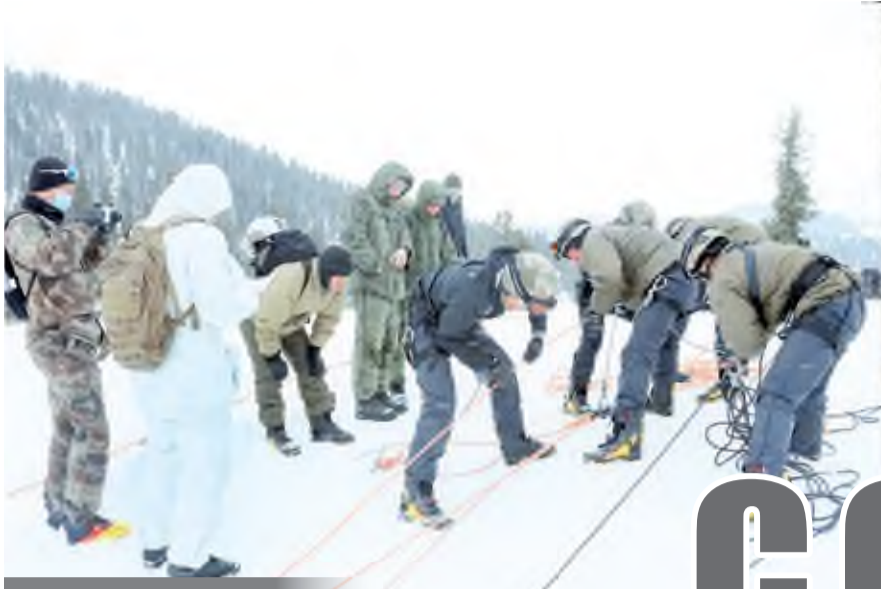
Халқаро армия ҳайиллари – 2021

доирасида юртдошларимиз «Саян юриши» мусобақаларига қатнашиш учун Россия Федерациясининг Тува Республикасига етиб келганидан хабарингиз бор.