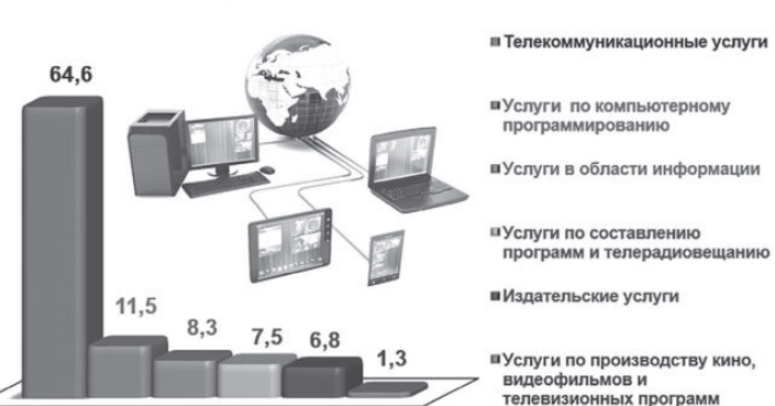
Структура услуг связи и информатизации по городу Ташкенту за 2020 год*

Вместе с тем в столице республики зафиксирован наибольший удельный вес услуг связи и информатизации - 9,1 процента. Это обусловлено тем, что Ташкент - город с довольно развитой информационно-коммуникационной инфраструктурой. При сопоставлении с другими регионами здесь отмечены наибольшие показатели услуг по компьютерному программированию, консультационным и другим сопутствующим услугам (11,5 процента), в области информации (8,3), по составлению программ и телерадиовещанию (7,5), издательским услугам (6,8), производству кино, видеофильмов и телевизионных программ, звукозаписи и изданию музыкальных произведений (1,3). Телекоммуникационные услуги в структуре услуг связи и информатизации заняли относительно невысокий удельный вес, составив 64,6 процента.