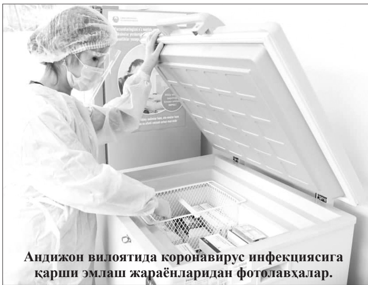
Андижон вилоятида коронавирус инфекциясига қарши эмлаш жараёнларидан фотолавҳалар.

Таъкидлаш жоизки, 2021 йилнинг 1-апрель куни мамлакатимизда оммавий эмлаш куни муносабати билан ўтказилган тадбирлардан кўриниб турибдики, халқимизнинг ўз саломатлигига бўлган эътибори кўзга ташланади. Айниқса, ёши улуг отахону ва онахонларимиз ҳамда тиббиёт ходимларининг бу жараёндаги фаолликлари таҳсинга лойиқдир.