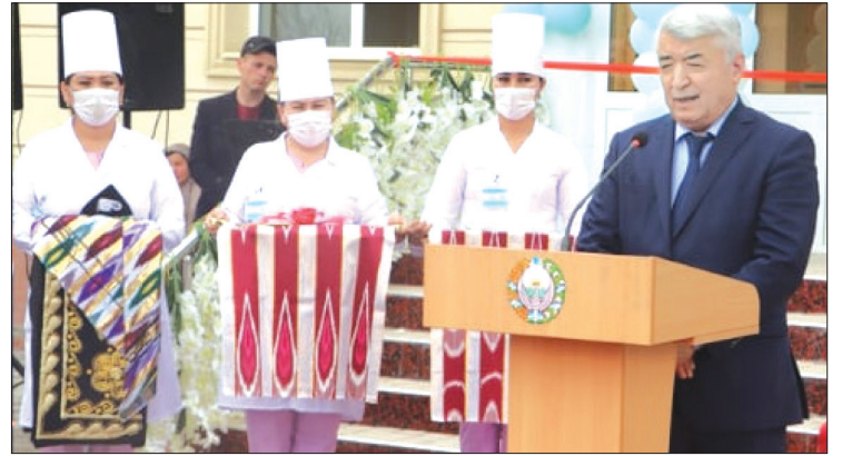
Диспансер Соғлиқни сақлаш вазирлиги томонидан замонавий тиббий асбоб ускуналари билан жиҳозланди.

Маълумот учун, ушбу диспансер Зомин тумани Ширин ҚФЙ, хушхаво Қудуқча қишлоғида жойлашган. Дастлаб, 1960 йилда худудда аҳоли орасида сил касаллиги авж олиб кетганлиги ва ўлим ҳолатлари кузатилганлиги муносабати билан, беморларни даволанишига шароит яратиш ва касалликни камайтириш мақсадида эски бино базасида ташкил этилган. Бунинг натижасида аҳоли орасида сил касаллиги ва ундан ўлим ҳолатларининг кескин камайишига эришилган.