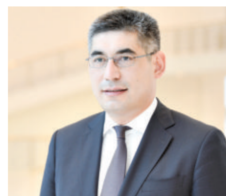
Шерзод КУДБИЕВ, Ўзбекистон Республикаси Давлат солиқ кўмитаси раиси

Шахсий масъулият, темир интизом, касбий ғурур ва профессионал маҳорат — ижро интизомининг мустаҳкам пойдеворидир