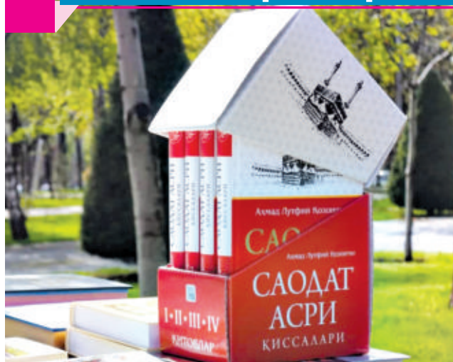
Мухтасар ТОЖИМАТОВА, "Янги Ўзбекистон" мухбири

Ўзбекистонда "Китобхонлик ҳафталиги" бошланди. 5 апрель куни Тошкент шаҳридаги Ёшлар ижод саройида тадбирнинг очилиш маросими бўлиб ўтди. Унда мактаб ўқувчилари, талабалар, шoir ва ёзувчилар, ноширлар, ташкилотчи идораларнинг масъул мутасаддилари иштирок этди.