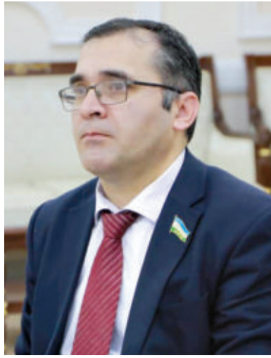
Қодир ЖўРАЕВ, Олий Мажлис Қонунчилик палатаси Халқаро ишлар ва парламентлараро алоқалар қўмитаси раиси ўринбосари