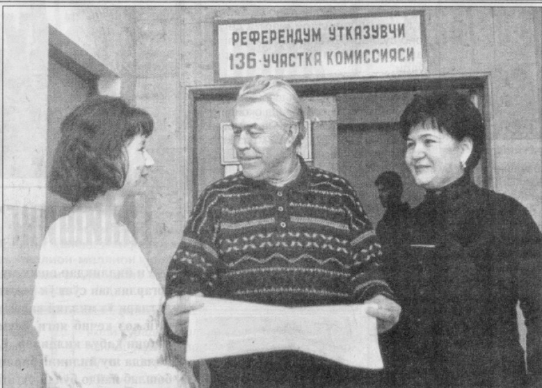
«Тошкент трактор заводи» ҳиссадорлик жамияти ҳузуридаги 136-участкада ҳам 27 январь куни ўтказиладиган умумхалқ референдумига қизгин тайёргарлик кўриломоқда. Бунда участка комиссияси аъзолари муҳим тадбирнинг ўтиши йўлида янада фаллиқ кўрсатишмоқда, ташаббускор гуруҳлар уни ўтказишга ҳар томонлама кўмак беришга ҳаракат қилишмоқда.

тириш, референдумда қузатувчиларнинг иштироки, референдумда иштирок этувчи фуқароларга ҳар томонлама қулай шарт-шароитлар яратиш тўғрисида ҳам навбатдаги мажлисда фикрлашиб олинди.