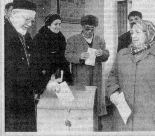
СУРАТЛАРДА: пойтахтимиз референдум участкаларида.