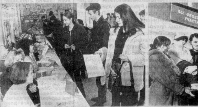
СУРАТЛАРДА: пойтахтимиз референдум участкаларида.

Шу ернинг ўзида Ислам Каримов маҳаллий ва хорижий оммавий ахборот воситалари вакиллари билан интервьюсида бундай муҳим ижтимоий-сиёсий тадбирлар ҳар қандай давлат ва жамиятни демократлаштиришга хизмат қилишини таъкидлади.