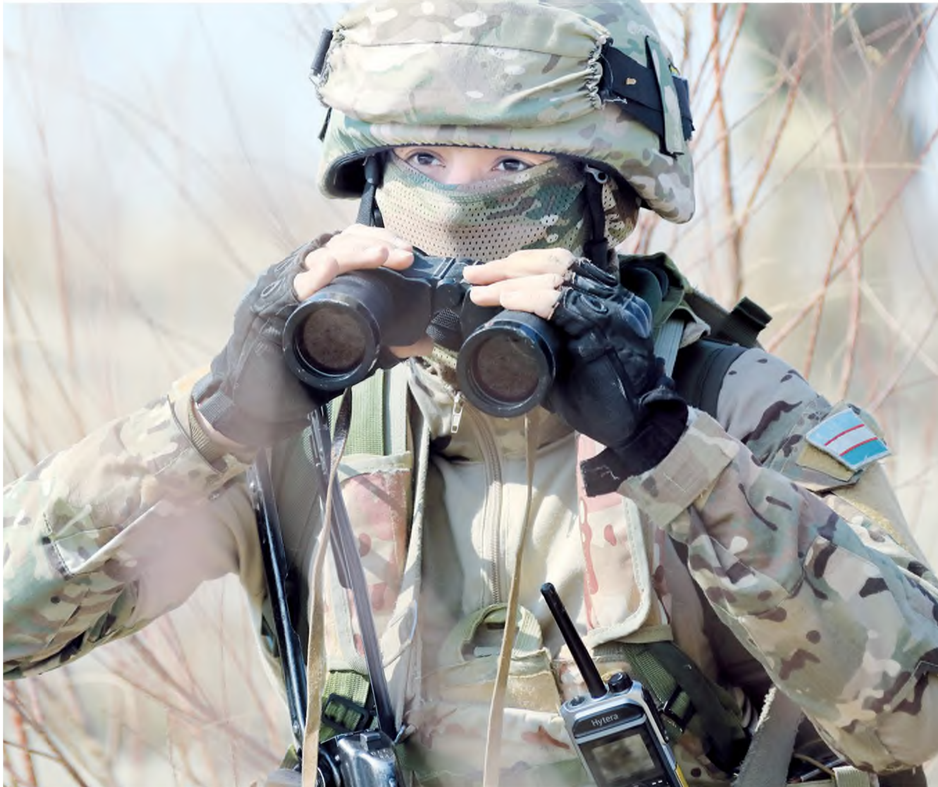
2021 йил 30 апрель, № 17 (2924)

Сайтимизга ўтиш учун QR-кодини сканер қилинг.