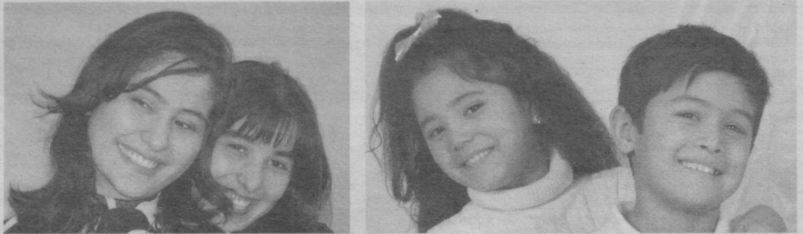
Урмирнинг баҳори бахтиёр ёшлигим.