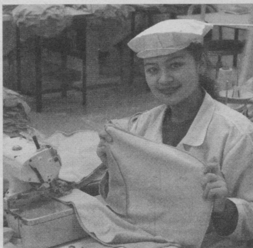
Шаҳримиздаги «Шайхонтоҳур текстиль» Ўзбекистон-Туркия қўшма корхонаси мамлакатимиз экспорт салоҳиятини юксалтиришга муҳим ҳисса қўшаётган корхоналар сирасига киради.

Марказий Офицерлар саройи, «Наврўз» тантаналар уйи, туманлар ҳокимликлари, шунингдек Ўзбекистон Республикаси Ички ишлар ва Фавулдода вазиятлар вазирликлари, Ўзбекистон Республикаси Давлат божхона кўмитасида Ватан ҳимоячилари ва Қуроли Кучларимизнинг 11 йиллигига бағишлаб ташкил этилган байрам тадбирларида юртимиз Мустақиллигини мустаҳкамлаш, халқимиз осойишталигини сақлаш йўлида фидоқорлик билан ўз хизмат вазифаларини ўтаётган ходимлар тақдирланди.