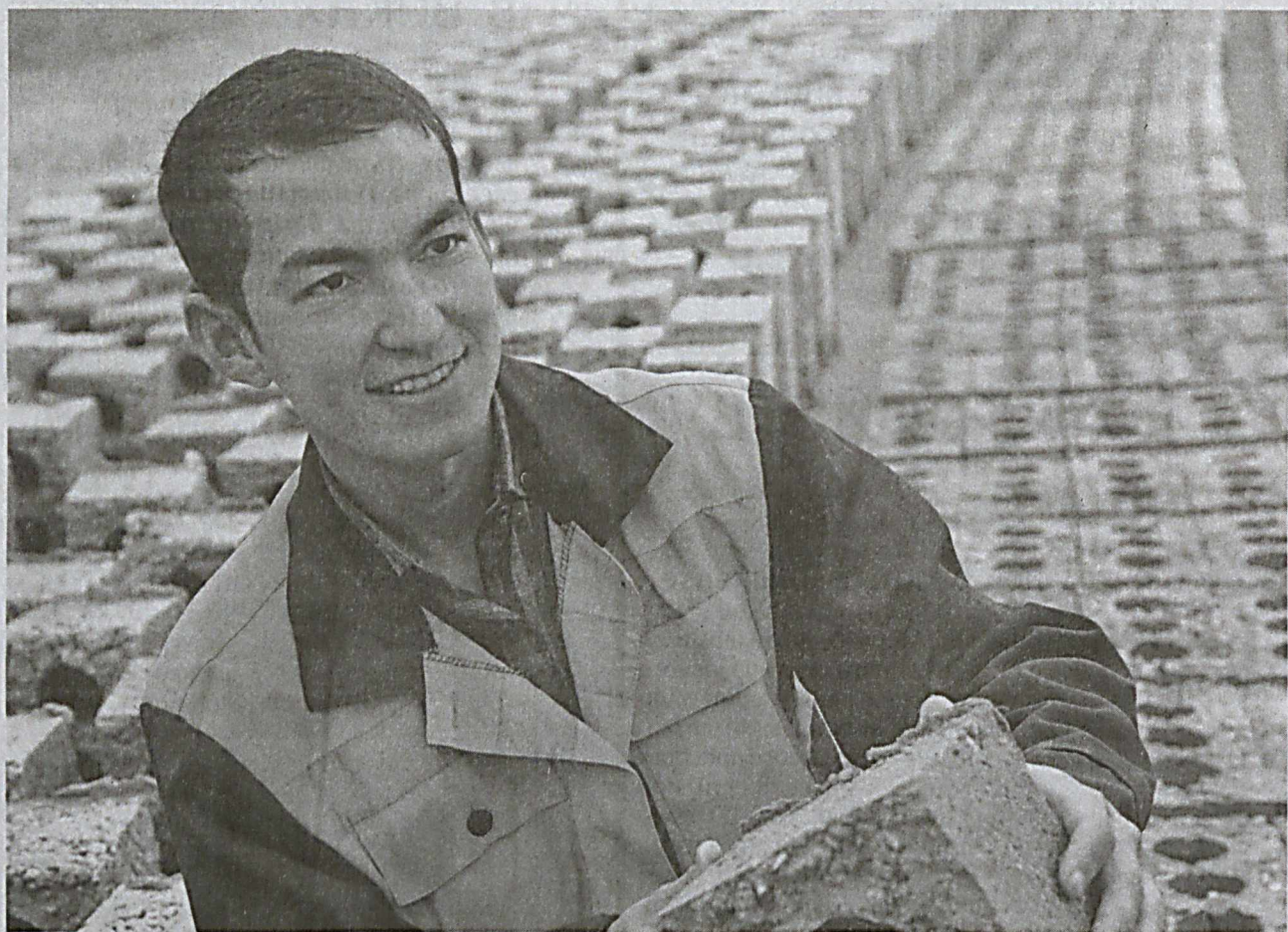
Жители схода граждан махалли имени Алишера Навои в городе Карши отличаются своей предпринимательской жилкой. На территории схода расположены торговые точки, пункты бытового обслуживания, швейные цехи.

Представители схода на постоянной основе изучают бытовые условия населения, ведут разъяснительную работу по эффективному использованию надомного