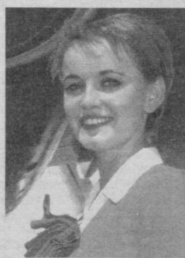
мизга ўзига хос совға бўлди.

Тошкент аэропортида янги халқаро андозалар талабларига жавоб берувчи учинчи залининг ёзда фойдаланишга топширилиши ҳам ҳамкорлиги-