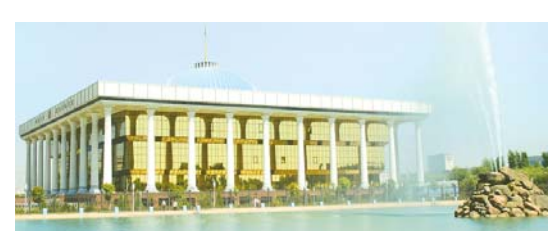
Спикера Законодательной палаты Олий Мажлиса, руководителя фракции Экологической партии Узбекистана.