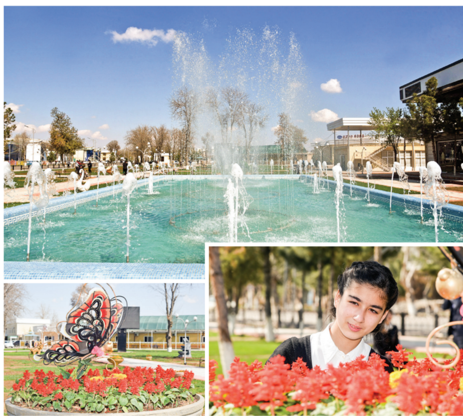
Суратларда: Қашқадарё вилояти Косон тумани марказида барпо этилган Ёшлар хиёбонида.

Тумани ҳокимлиги ахборот хизматининг маълум қилишича, айна пайтда Ёшлар хиёбонида шахмат клуби ҳамда дам олувчиларга савдо ва бошқа хизмат турлари кўрсатадиган тадбиркорлик объектлари барпо этиш бўйича ишлар олиб борилмоқда.