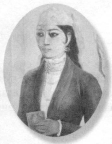
УВАЙСИЙ (1779 – 1845)