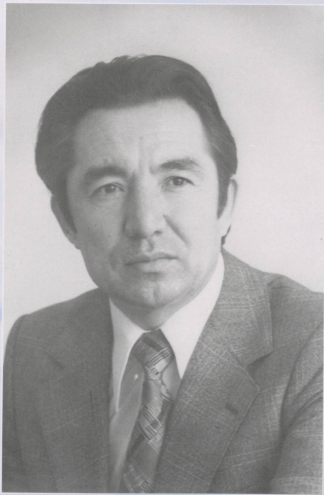
Ўзбекистон халқ шоири Барот БОЙҚОБИЛОВ (1937 – 2006)