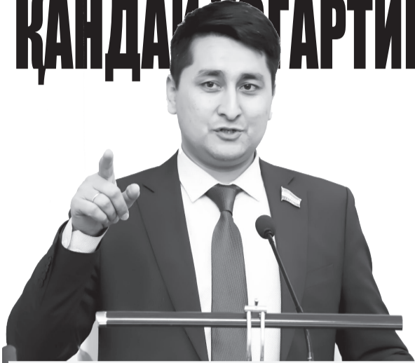
Фирдавс ШАРИПОВ, Олий Мажлис Қонунчилик палатаси депутати

Таъкидлаш жоиз, сайлов тўғрисидаги амалдаги қонунчиликнинг тахлиллари сайловчилар билан учрашувлар ўтказиш ҳамда сайлов комиссияларининг ҳаракатлари ва қарорлари устидан шикоятлар бериш борасида айрим муаммолар мавжудлигини кўрсатмоқда.