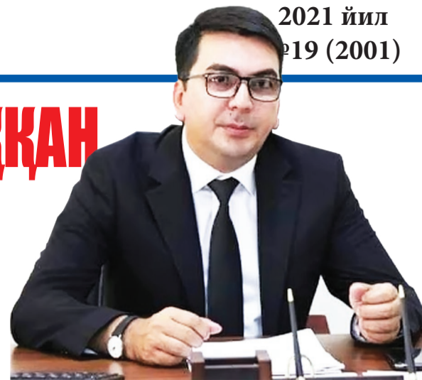
Жаҳонгир ЗИЯЕВ, Олий Мажлис Қонунчилик палатаси депутати.

Устозларнинг айтганича бор экан: вазирнинг тўрт нафар ўринбосари бўлса-да, ҳеч бири мактабда ишламаган, асосан, техник ва молиячилар экан. Марказий аппаратнинг 40 кишидан иборат жамоасидан атиги адашмасам олти нафари мактабда ишлаган экан, холос. Сайтда вилоят бошқармалари бошлиқлари ҳақида маълумот берилмаган бўлса-да, энди уларнинг ҳам кўпчилиги таълимга алоқаси йўқлигига шубҳам қолмади.