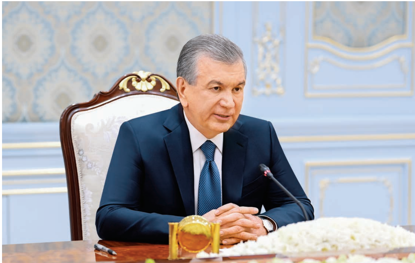
14 мая Президент Республики Узбекистан Шавкат Мирзиёев принял Премьер-министра Республики Таджикистан Кохира Расулзоду, находящегося в нашей стране с рабочим визитом для участия в очередном заседании Совместной Межправительственной комиссии.

Были рассмотрены вопросы дальнейшего расширения многопланового практического сотрудничества,