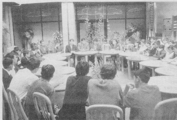
Ёшларнинг ҳақиқий суянчи ва таянчига айланиш йўлида фаолият юритаётган «Камолот» ЁИХнинг Юнусобод туман бўлими кенгаши томонидан ўтказилаётган давра суҳбатлари, қизиқарли учрашувлар, олимпиада ва конференциялар эртанимиз давомчиларининг хуқуқий саводхон, кенг салоҳиятли инсонлар қаторидан ўрин олишларида муҳим омил бўлмоқда.

СУРАТЛАРДА: «Камолот» ЁИХ Юнусобод туман бўлими кенгаши томонидан «Бунёдкор» ёшлар телеклубида ўтказилган «Саломатлик — туман бойлик» мавзусидаги давра суҳбатидан лавҳалар.