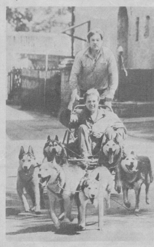
Итларни яхши биладиган одамларга лайка зотига мансуб итларнинг қатор афзалликлари ахши маълум. Кўч жонхатидан, бардошлилиги жоҳатидан уларга тенглашадиган жуда кам бўлади. Уларнинг довораклиги эса ҳар қандай мақтовга арзийди. Улар айниски Шимолда ўз фазилатларини тўла намойиш этадилар. Шу ерда улар инсоннинг энг яқин кўмакчисига айланиб қолишган. Билиш шахри яқинида (Шимоллий Чехия) истиқомат қилувчи Дольей олмасининг аъзолари ҳам лайка итларининг муҳлис-ларидир. Мана етти йилдирки улар ана шу зотли итларни кўпайтириб келишади. СУРАТДА: Дольей олмасининг итлари қўшилган аравача. ЧТК—ТАСС сурати.

Покистон агар у мамлакатимиз билан муносабатларни яхшилашни истаса, Ҳиндистоннинг ички ишларига аралашшини тўхтатиши лозим, деди ПТИ ахборот агентлигининг муҳбирини билан қилган суҳбатда Ҳиндистон ташқи ишлар министри Индер Кумар Гужрал. Гужрал Панжоб ҳамда Жамму ва Кашмир штатларида ҳаракат қилаётган террорчиларни Исломобод фаол қўллаб-қувватлаётгани ва тайёрлаётгани муносабати билан ташвиш билдириб, фақат «Покистон Бизнинг ички ишларимизга аралашши ёмон оқибатларга олиб келишини тан олган тақдирдагина» икки мамлакат ўртасида Силл битими рўйхатиди мuloҳот бўлиши мумкинлигини таъкидлади.