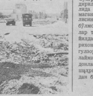
«Тошкент оқшомига» жавоб берадилар

«Оқшомга хатлар» рукуни остида ана шундай сарлаҳали таққидий мақола «Тошкент оқшоми» рўномасининг 13 апрель сонида босилиб чиққан эди. Унда Навоий ва Энгельс кўчалари ўқир-чўқир эканлиги, икки томонидаги эски уйлар унинг кўрғина соя солаетгани, Навоий кўчасининг икки ёнидаги юриш йўлакларига эса 15—20 йилдан буён таъмирланмаётгани сингари нуқсонлар очиб ташланган эди.