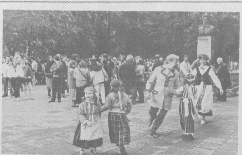
© ЛИТВА, Мана шу кичик, илгари камдан-кам тилга олинадиган республикага, бугунги кунда бутун дунёнинг эътибори қаратилган. Парламентда ҳис-ҳажонлар жўнбушга келаяпти, ҳаёт эса давом этмоқда: ошқин-машҳуқлар учрайти, болалар катта бўлапти, Инсон ақл-қароки албатта галаба қозонади ва шу ўлкада тиқилки қарор топади. СУРАТДА: Вильнюсдаги Қальали тоғ этагида халқ сайли.