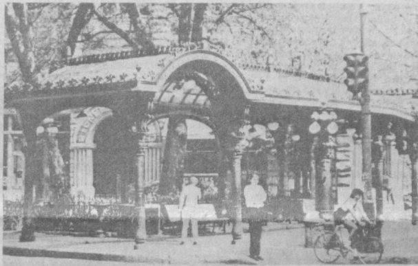
© СИЭТЛ. Шаҳар боғларидан бирдаги томонга шийпони.

лашган Тошкент ва Сиэтл шаҳарлари ҳам муносаб улдуш қўшишмоқда. Биз Ўзбекистон пойтахтидан Океан ортига йўл олган вакилларимизга уларнинг хайри сафарларида омадлар тилаймиз.