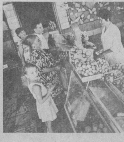
© СУРАТЛАРДА: Ленин район улгурчи-чакана савдо мева-сабзавот комбинатига қарашли 17 ва Куйбишев район улгурчи-чакана савдо мева-сабзавот комбинатига қарашли 6-магазинда савдо пайти.