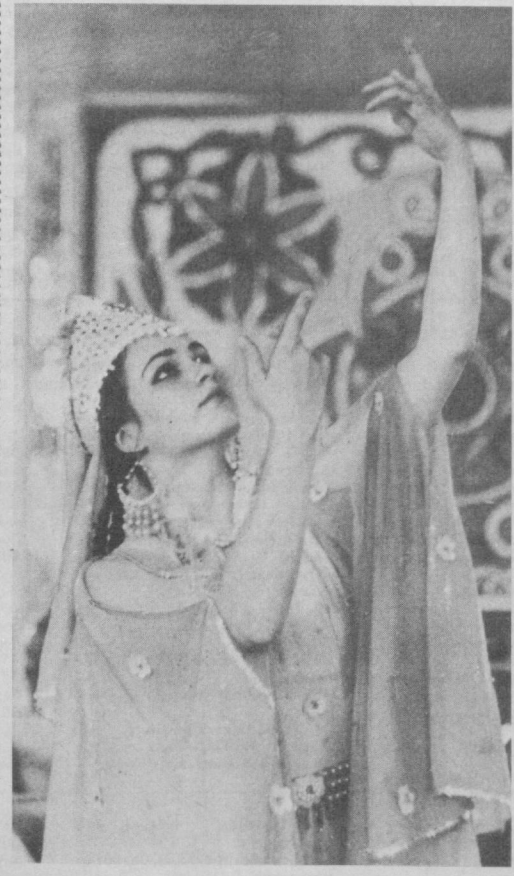
● РАҚОСА ХИРОМ ЭТГАНДА. Д. Аҳмедов сурат лавҳаси.