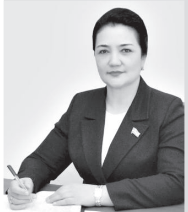
Мавлудахон Хужаева. Председатель Комитета по труду и социальным вопросам Законодательной палаты Олий Мажлиса Республики Узбекистан.

Одним из важных требований демократического общества является обеспечение права каждого человека на свободный выбор профессии, справедливые условия труда и защиту от безработицы. В период глобальной пандемии реализация этих задач становится актуальной для каждого государства.