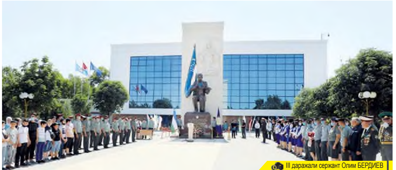
III даражали сержант Олим БЕРДИЕВ

Азиз ўқувчи, бирор қишлоқда музей кўрганмисиз? Кўрмаганман, дейсизми? Мен ҳам кўрмаганман. Аммо бу дегани қишлоқларда музейлар бўлмайди, дегани эмас-да. Ҳатто ҳар бир хонадонда ҳам ўзига хос музей мавжуд. Бу гапим билан шаҳарларда жойлашган улкан музейлар обрўсига «путур» етказиш ниятим йўқ. Шунчаки, сиз билган нарсаларни ёдингизга солгим келди.