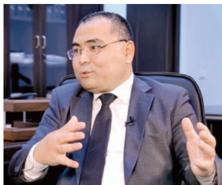
Иброҳим АБДУРАҲМОНОВ, инновацион ривожланиш вазири, академик

Давлатимиз раҳбарининг Рамазон ҳайити арафасида Республика ихтисослаштирилган гематология илмий-амалий тиббиёт маркази ҳамда Республика ихтисослаштирилган онкология ва радиология илмий-амалий тиббиёт маркази каби шифо масканларига ташири оммавий ахборот воситаларида кенг ёритилди. Жамоатчилик орасида ижобий акс-садо берди.