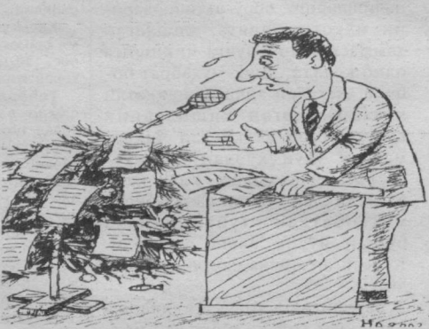
Янги йил ҳазиллари Абдураҳул Ҳақимов чизган расмлар.