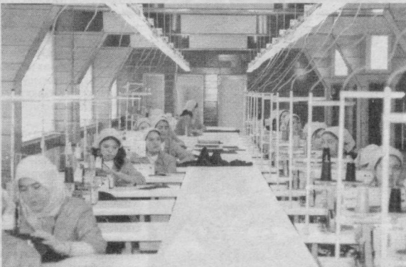
«Мурувват текс» масъулияти чекланган жамиятининг иш бошлаганига ҳали кўп вақт бўлгани йўқ. Аммо ишлаб чиқарилаётган маҳсулотлар замонавийлиги билан ўз харидорини топмоқда. СУРАТЛАРДА: Дилафрўз Мирзаева сифатга алоҳида эътибор қаратади; корхонада малакали чеварлар меҳнат қилишмоқда.