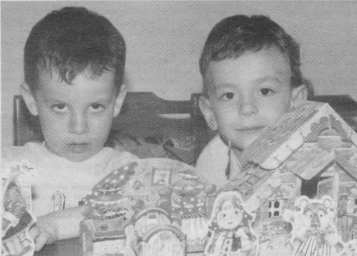
Болаликнинг завқли олами — ўйинчоқлар дунёси.

Кутуриш касаллигининг олдини олиш фақат тиббиёт ходимларининггина иши бўлмай, балки милиция органлари, ветеринария ходимларининг ишига айланиши керак.