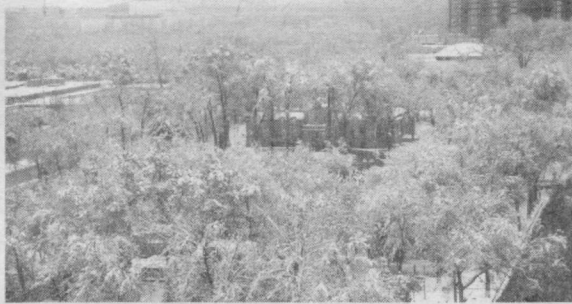
Табиатнинг қалби ила безатилган қишки гўзаллик.

Олим ТШЕВ, Тошкент Молия институту талабаси.