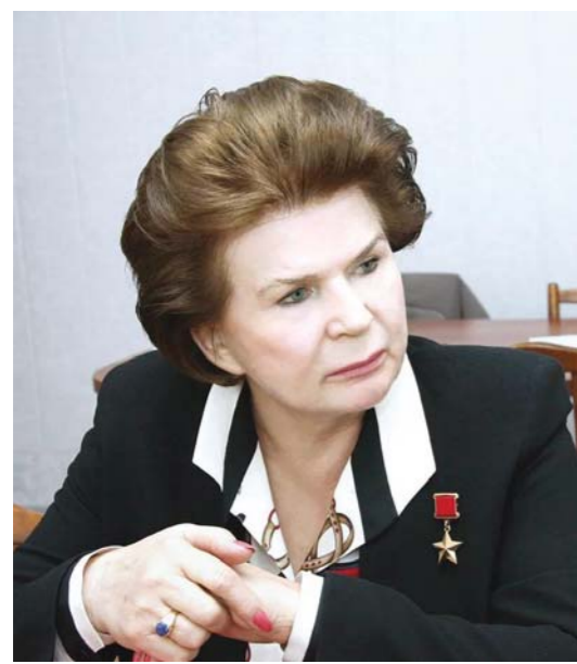
Гиряя Валентинаю дуктараш