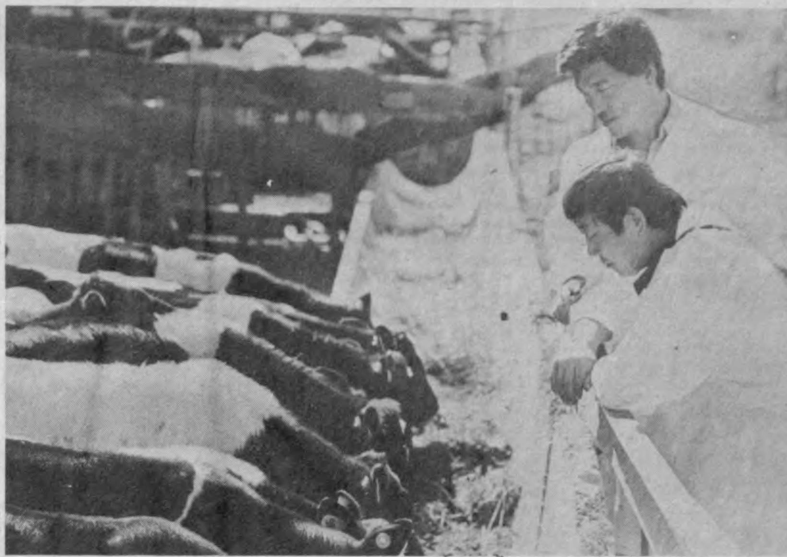
Урта Чирчиқ районидagi Ким Пен Хаа номли колхоз фермаси ҳўжаликнинг бошқа бора бўлимларини каби ижара кооперациясига ўтиб ишлапти...