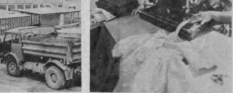
М. ЭРАЛИЕВ, «Қишлоқ ҳақиқати» муҳбири.