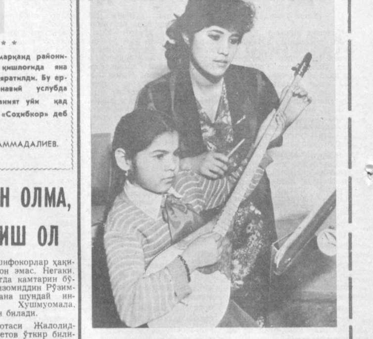
Саодат Ёшлиғиданоқ санъатнинг сирин оламинга қизиб қолди. Оруу кейинчалик уни Термидадаги мусиқа мактабига етаклади.

Элликқалъа районидagi «Қирқизобод» жамоа тўжалигида маданий-маърифий бинолар қурилишига алоҳида эътибор берилляпти.