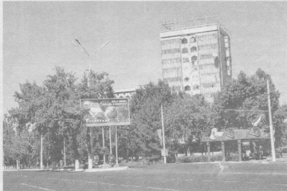
Азим пойтахтимиз хуснига-хусн ўқиб турган осмонлар бинолару мухташам кошоналар мустақиллик меvasи бўлиб, кўрган кўзларни кувнатмоқда.