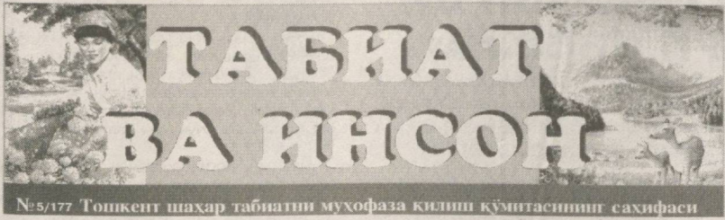
№5/177 Тошкент шаҳар табиатни муҳофаза қилиш қўмитасининг саҳифаси

— Ўзбекистон Республикасининг табиатни муҳофаза қилиш тўғрисидаги бундан қонунчилиги, 2006-2010 йилларга мўлжалланган экологик жиҳатдан соғломлаштиришнинг ҳудудий дастурини бажариш билан боғлиқ даярлик барча вазирлар хизматларимизнинг доимий диққат-эътиборидадир, — дейди Ш.Хикматов. — Объектлар, табиатдан фойдаланишни меъёрлаштириш юзасидан доимий давлат назорати олиб борилади, кўча ва стационар атмосфера ҳавосини ифлослантириш манбаларини асбоб-анжомлар билан ўлчай олиш амалга оширилади. Ичимлик суви ва оқова сувлар тармоқлари, атмосферани ифлослантириш даражаси мониторингини ўтказиш постлари модернизация қилинмоқда, хусусан, Салор аэрация станциясининг қўйи қисмида Салор каналининг ифлосланиши даражасини кузатиш бўйича янги пост ташкил этилди, шаҳарни қўқаламзорлаштириш бўйича оммавий тadbирлар ўтказилди.